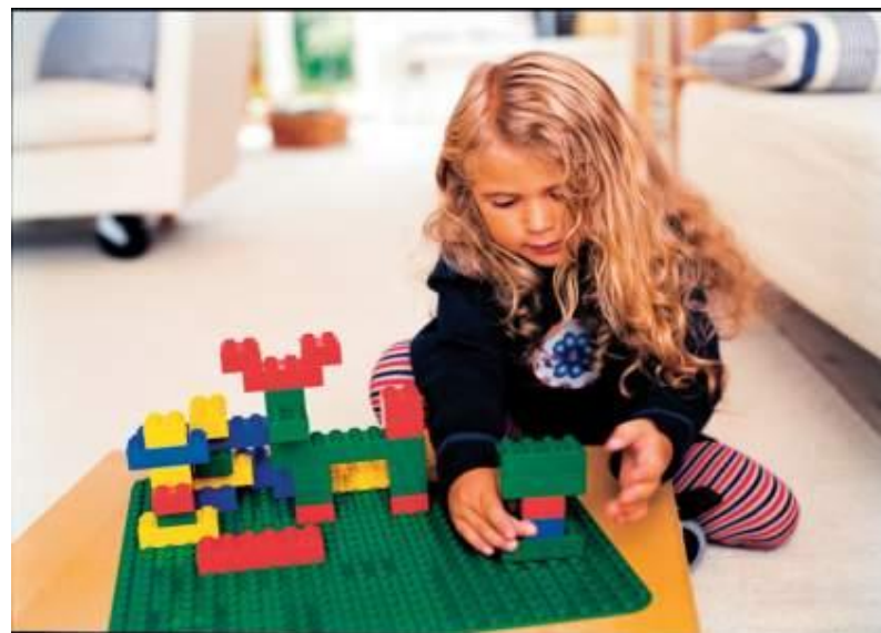
Гигантский набор Дупло

Разнообразие LEGO конструкторов позволяет заниматься с обучающимися разного возраста и различных образовательных возможностей.